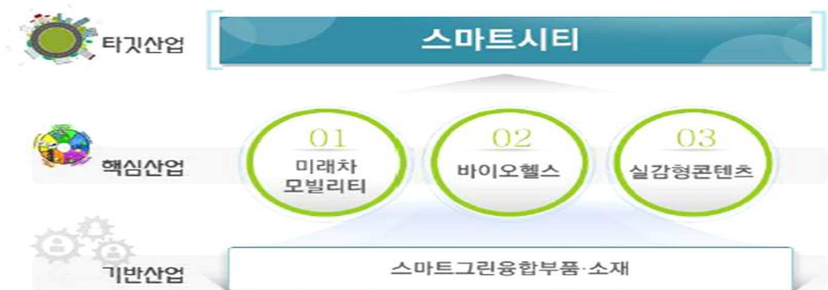
〈그림 1-2〉 세종시 미래먹거리 산업